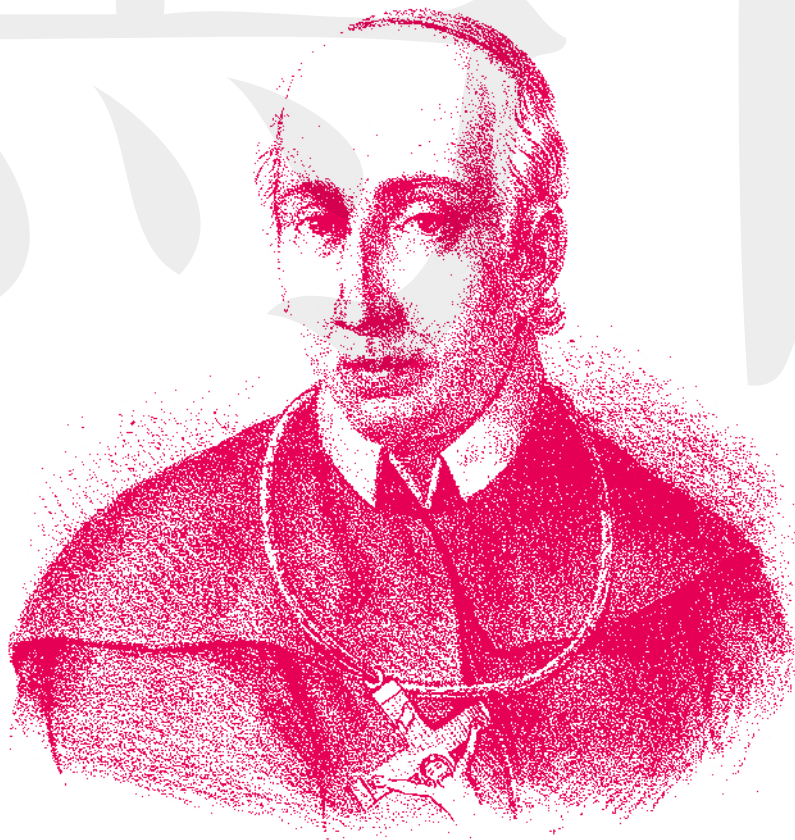
Ritratto litografico di Matteo Ripa, fonte: Poliormama Pittoresco, Tipografia e litografia di Filippo Cirelli, Napoli 1839.